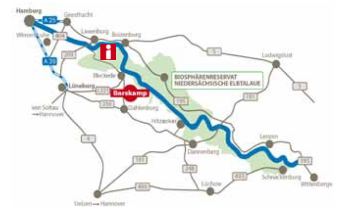
Eine Detailkarte zum Schieringer Forst finden Sie auf der Innenseite