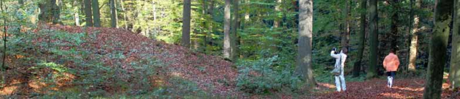
Der sogenannte Opferberg erhebt sich fast vier Meter hoch im Buchenwald